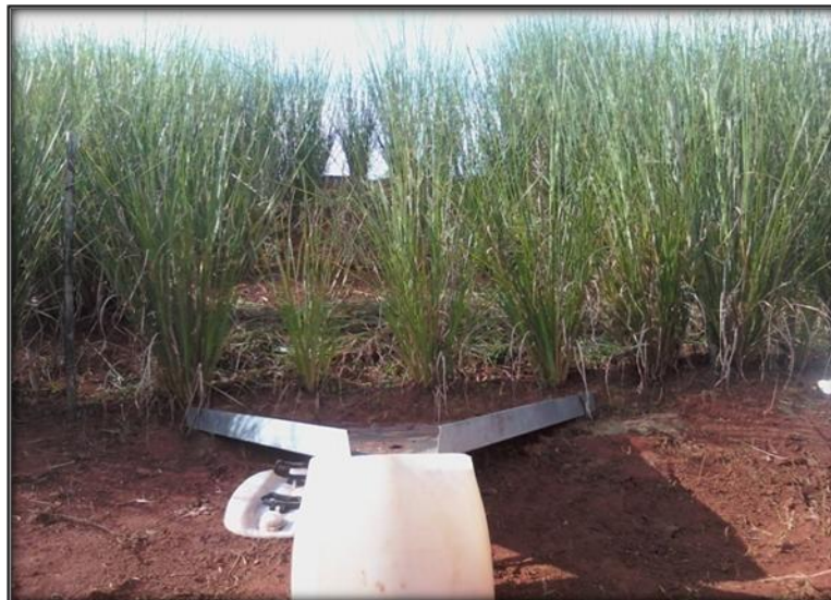
Figura 02. Calha e balde em uma parcela do experimento, Inconfidentes/MG.

No início de janeiro de 2011, com as plantas já estabelecidas, quantificou-se a perda de solo por erosão durante quatro diferentes precipitações pluviométricas, conforme tabela 01.